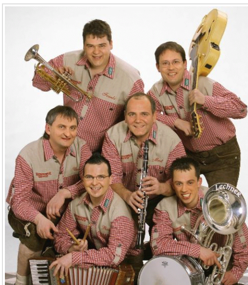
Auch das Schwarzwald-Quintett wird zu Gast auf der Benefizgala am 4. Februar sein.