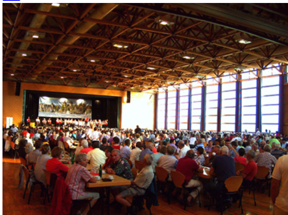
Hafenkonzert in Arbon