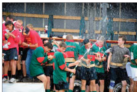
Platz 3 für die Jugendmannschaft Simonswald wird gefeiert.

ziehfreunde Böllen den Meistertitel erzogen.