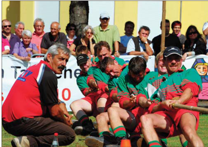
Die Simonswälder legten sich mächtig ins Zeug.