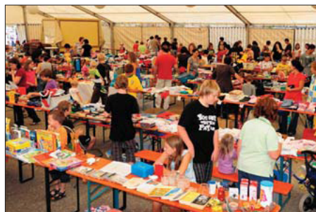
Ein buntes Angebot gab es beim Kinderflohmarkt.